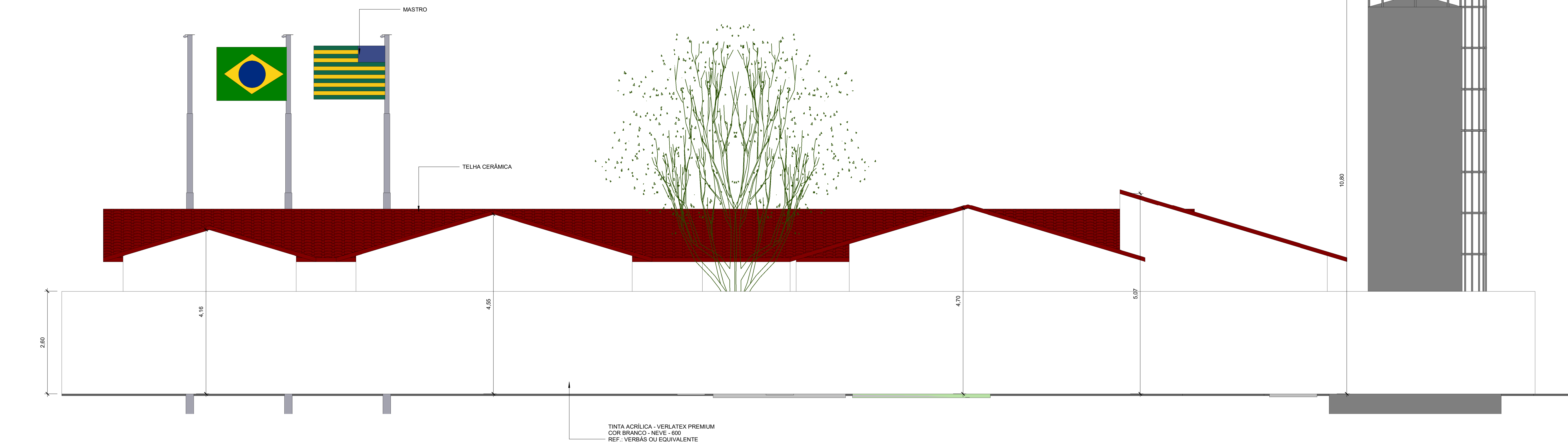
4 FRACHADA POSTERIOR 1 : 50